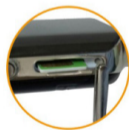
2. Use forceps cover into the mobile phone card

Bwatch Kids: необходимо вставить сим-карту в слот и закрыть крышкой так, чтобы она была зафиксирована металлическим фиксатором.