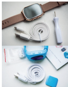
Комплект Bwatch Teens

Перед использованием GPS-часов проверьте комплектность товара: